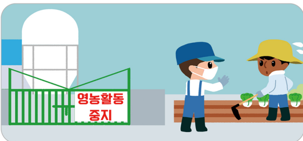
축산 관계자는 영농활동을 중단하고 외국인 근로자가 텃밭 경작을 하지 않도록 안내