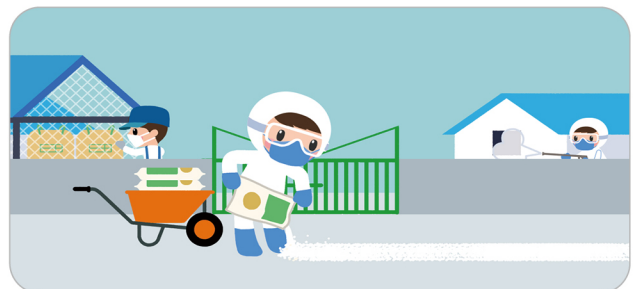
매일 농장 주변 청소·소독, 진출입로 생석회 도포, 그물망(조류차단망) 등 방역시설 점검