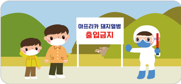
아프리카돼지열병 발생지역 출입 금지