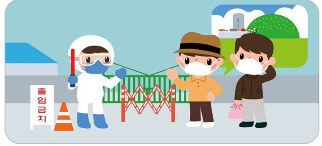
별초·성묘에 참여한 가족과 외부인은 농장 출입 금지