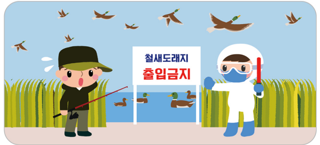
철새도래지 출입 금지