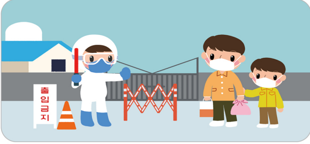
축산농가 방문 자제, 농장 출입통제 철저